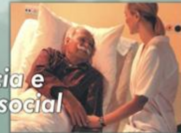
Assistência e apoio social