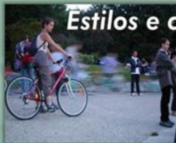
Estilos e condições de vida