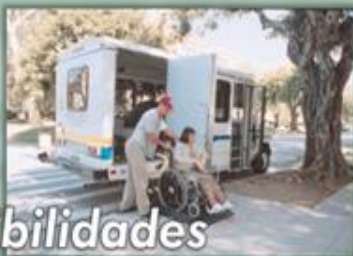
Acessibilidades e transportes