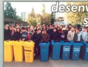
Ambiente e desenvolvimento sustentável