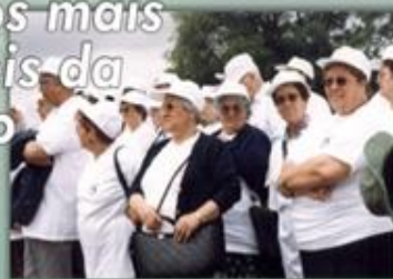
Necessidades especiais dos grupos mais vulneráveis da população